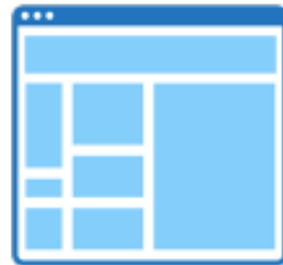
sidebar sidebar content