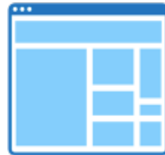
content sidebar sidebar