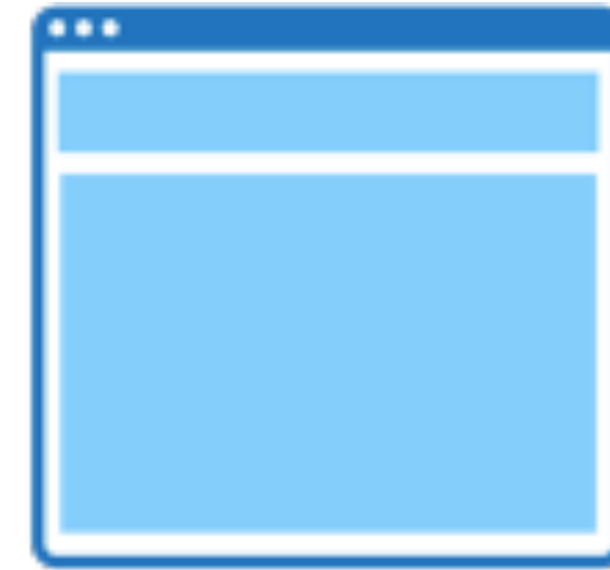
full width content